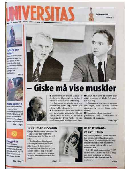
Leiaren av Mjøsutvalet i kjent stil.

Ved felles lov ligg det til rette for at departementet kan ha ei sams forvaltning av heile høgskulesektoren og at staten så vert institusjonseigar på line med andre private